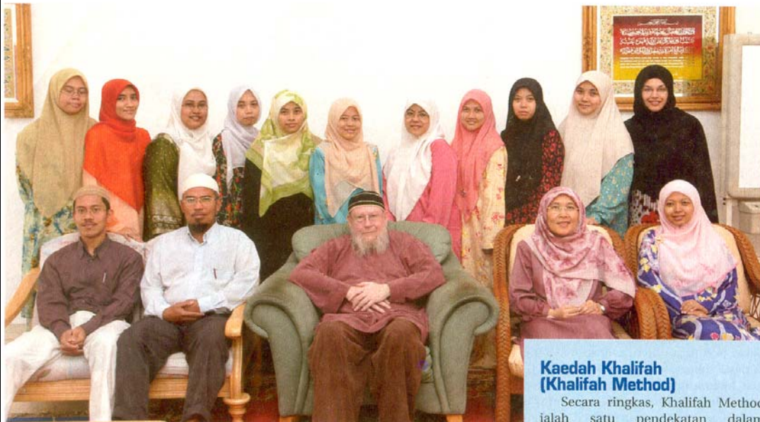
Bersama sebahagian staf dan pemegang amanah.

memiliki karakter yang Islamik dengan tahap pencapaian akademik yang tinggi, kerana dengan cara itulah umat Islam akan menjadi umat yang maju di dunia," ujar beliau.